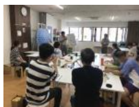
救急隊員の方による講習

昨年10月15日、三田市消防本部より救急隊員の方にお越しいただき応急手当講習会を実施しました