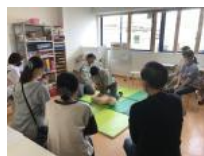
心肺蘇生デモンストレーション